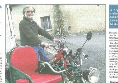
Les collectionneurs craignent que le coût du contrôle technique conduise bon nombre de cyclos à la casse.

À compter du 1 er janvier, les cyclomoteurs anciens seront soumis au contrôle technique. Une mesure que les collectionneurs jugent inutile et inadaptée.