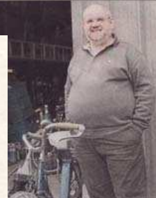
Duhaut redoute « la mort des cyclomoteurs »

portements humains qui sont à l'origine des accidents. Ce n'est pas la faute des propriétaires.